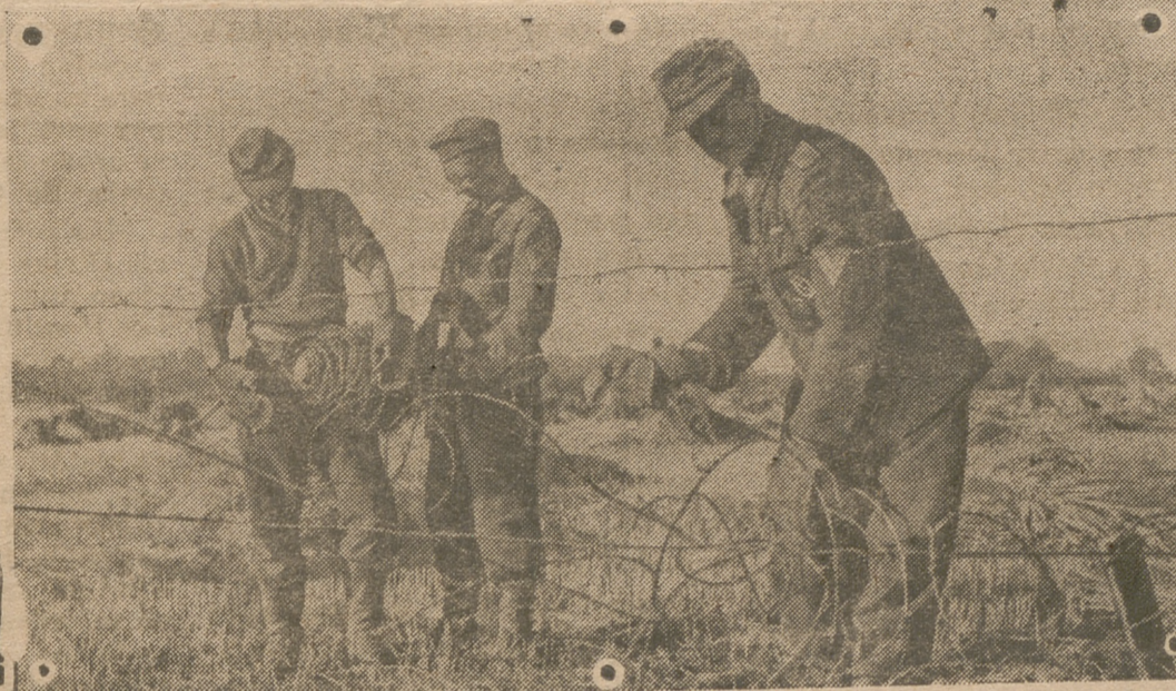
Soldados alemanes colocando alambradas para impedir el avance de las tropas soviéticas rechazadas en contraataque.

defensiva del sector industrial de la Alta Silesia todos los ataques rusos han fracasado con elevadas pérdidas para los atacantes, la situación se ha agravado durante el día de ayer al norte de la región industrial. Un importante grupo de combate ruso consiguió llegar hasta la parte norte de Gleiwitz, donde violentos combates de casa en casa se están librando, si bien la mayor parte de las fuerzas que habían logrado esta penetración han sido destruidas.