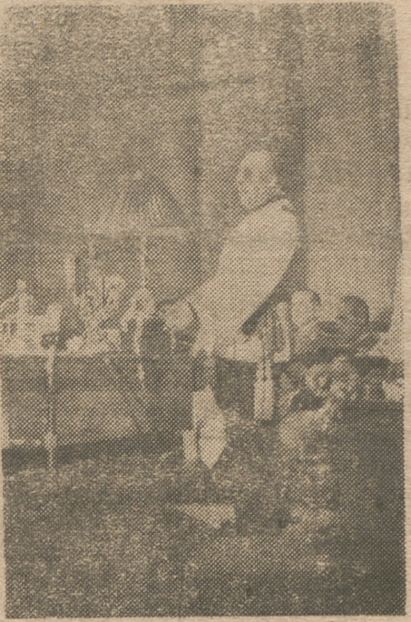
S. E. el Jefe del Estado y Generalísimo de los Ejércitos durante su discurso en la solemne sesión de clausura del III Consejo Sindical.

moderna todo tan íntimamente ligado que son los propios empresarios los que piden un día y otro a los Poderes públicos medidas para su protección, y no hay poder que pueda permanecer ya indiferente a las crisis que amenazan a las industrias o a los campos. La dirección de la economía por el Estado, exigencia ineludible de los tiempos difíciles y de las economías enfermas, en mayor o menor escala, todos los pueblos la vienen practicando. La guerra, con sus ingentes gastos y destrucciones, ha afectado intensamente al antiguo orden económico poniendo en período de revisión las viejas doctrinas. Ya nadie se asusta al escuchar a los hombres responsables de la economía de los pueblos anunciar la continuación de las medidas de inter-