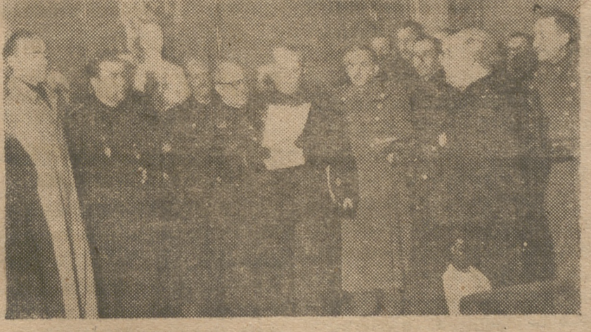
S. E. el Jefe del Estado recibió a la comisión de ferroviarios que fue a ratificarle su gratitud y adhesión por las mejoras sociales que les ha dispensado.

y herramientas en Bilbao, con fábricas propias, solicita representante Avila y provincia. Contestación escrita a mano. Dirigirse «ALAS» Concha, 13. — BILBAO.