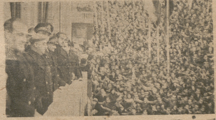
El Caudillo contemplando la inmensa multitud que espontáneamente se unió a los ferroviarios para aclamarle ante el edificio de la Secretaría General.

«A los españoles les costó dos años y medio de dura lucha su liberación del terrorismo; por eso el Régimen español se construyó sobre el esfuerzo denodado de sus hijos, demostración clara de una voluntad, más sincera cuando los pueblos luchan que cuando votan.» (Del discurso del Caudillo, en la clausura del III Consejo Sindical Industrial).