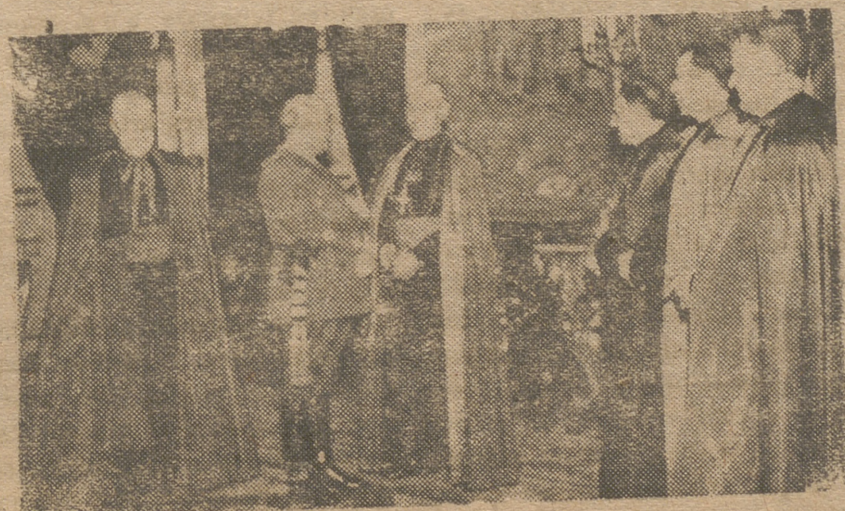
S. E. el Generalísimo ha recibido el juramento del Arzobispo de Burgos y de los Obispos de Segovia, Segorbe, Orense y Oribuena, que fueron recientemente nombrados.—(Foto S. O. C.)

MADRID.—Bajo la presidencia del ministro de la Gobernación se ha reunido el Consejo de Sanidad, tomando se importantes acuerdos sanitarios. —(Cifra)