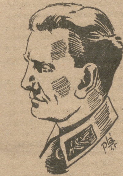
José Broz, alias Tito, jefe del Movimiento de liberación yugoslavo.

Alternadores y Motores explosión pagando bien. Apartado 15. DURANGO