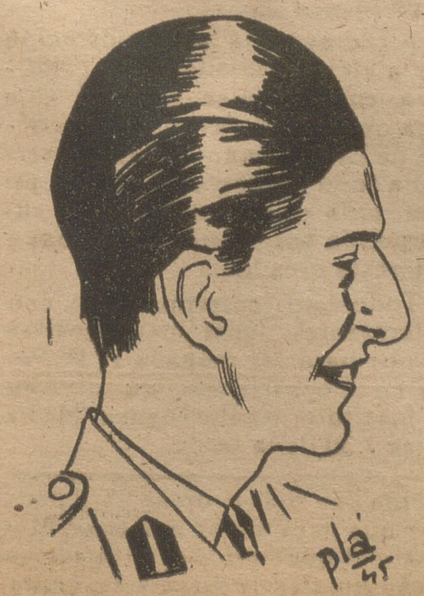
Rey Pedro de Yugoslavia.