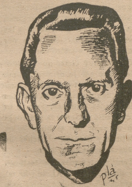
Herr Goebbels el activo e indispensable ministro de Propaganda del Reich que a diario proclama al mundo su inquebrantable fe en la victoria alemana. (S. O. C.)

«Tras el frente oriental se encuentra la nación entera, firmemente decidida a darle todo por su existencia. Todas las miradas se concentran en el frente del Este. Saben que se ha desencadenado