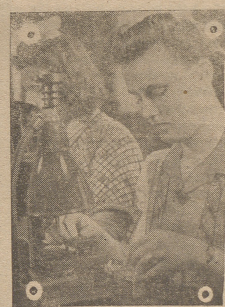
Das muchachas trabajando en el taller de una industria de guerra.