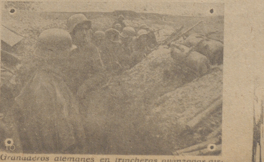
Granaderos alemanes en trincheras avanzadas dispuestas para un contraataque.