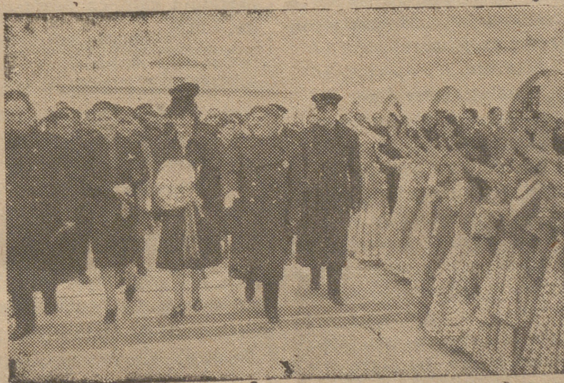
El Generalísimo, acompañado de su esposa y del Ministro secretario, de Pilar Primo de Rivera y otras personalidades inaugura dos nuevos centros de Auxilio Social con ocasión de su VIII aniversario.

nes del mundo, rinde justicia a los periódicos extranjeros serios y a la totalidad de la Prensa portuguesa, que no acogieron tales rumores y han reflejado siempre una visión objetiva y exacta de la realidad. —EFE.