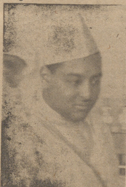
S. E. I. el Jefe del Estado se encuentra en la capital de España.—(S. O. F.)

El Caudillo tomó juramento del cargo de consejero nacional al jefe provincial y gobernador civil de Vizcaya, don Jenaro Riestra.