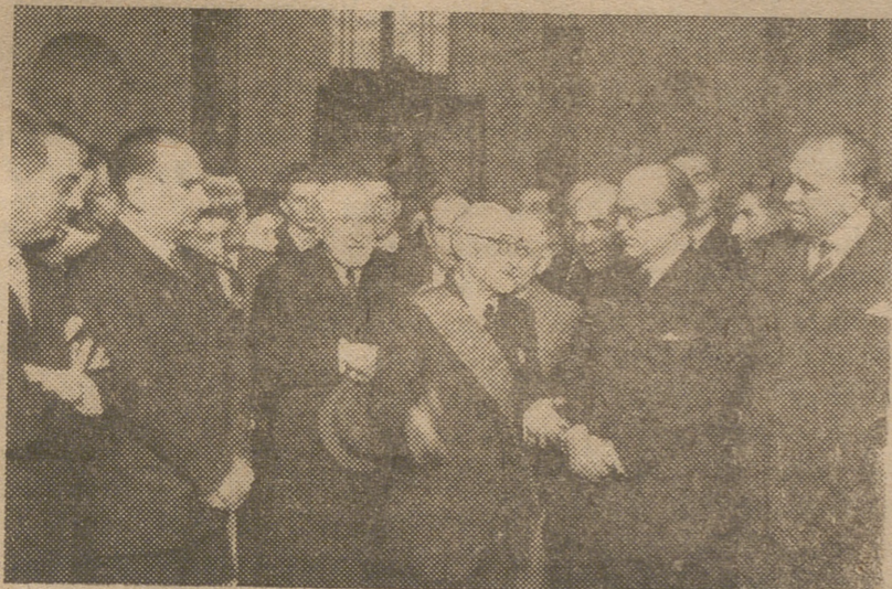
En el homenaje nacional celebrado en honor de don Jacinto Benavente se le impone la Gran Cruz de Alfonso X el Sabio, por el ministro de Educación Nacional en presencia del ministro secretario general del Movimiento y el de Justicia.

La elección del domingo ha esclarecido muchas cosas, entre otras unas ansias grandes de preparar a nuestro pueblo un porvenir próspero, fraternal, pacífico, de completo bienestar cristiano.