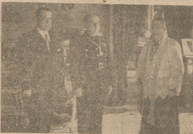
El Caudillo recibe la imposición de insignias de congregante de esclavo del Santísimo Sacramento.

MADRID.—La Junta de la Congregación de Indignos Esclavos del Oratorio del Caballero de Gracia, presidida por su rector, impuso ayer mañana, en el palacio de El Pardo, a S. E. el Jefe del Estado y Generalísimo de los Ejércitos la medalla de hermano mayor de la Congregación, cumpliendo así el acuerdo adoptado por aquella.