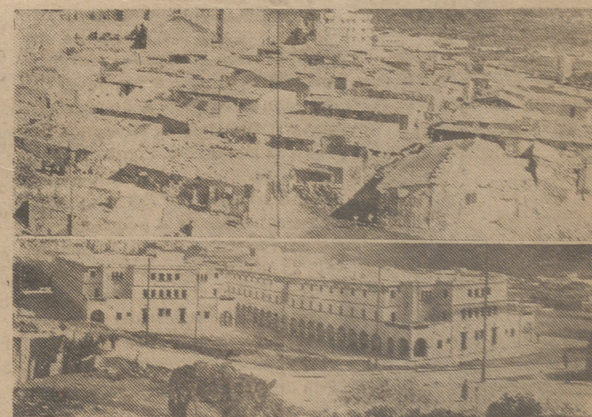
En menos de un año la Comisaría de España en Marruecos, por iniciativa de su Alto Comisario, convirtió en bello y agradable rincón lo que antes era barrio miserable e inhumano. Estas 232 viviendas construidas dan idea de la política de la vivienda española.