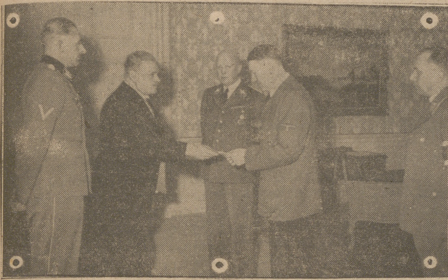
Altas personalidades cumplimentan al Führer