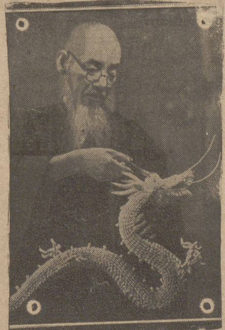
Los japoneses tienen infiltrado el sentido del arte. He aquí en esta foto como un viejo japonés con papel y unas tijeras crea rápidamente un precioso dragón.

el auténtico segundo frente sin necesidad del concurso tan codiciado de Turquía y tal vez sin tener que correr el riesgo tan temido del asalto por el Oeste.