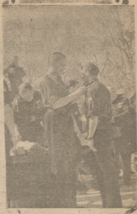
El camarada Carlos Ruiz, jefe provincial del Movimiento y gobernador civil de Madrid impone la Medalla de la Vieja Guardia a multitud de camaradas ante la Falange madrileña concentrada para una gran revista en el Paseo de Coches del Retiro.

LONDRES, 27.—«Se confirma que el ex primer ministro húngaro De Kállay se ha refugiado en la Legación turca de Budapest», escribe el corresponsal del «Times» en Angora, quien añade: «Se cree que el Gobierno turco pedirá que sea respetado el ex primer minis-