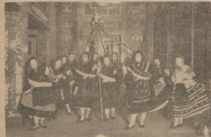
Uno de los grupos que más han llamado la atención en el concurso de Coros y Danzas organizado por la Delegación Provincial de la Sección Femenina y que han tenido lugar en el Teatro Español de Madrid.

He aquí razones más que suficientes para hacer inolvidable en las mentes españolas, y particularmente abulenses, la fecha de hoy. Mas no solo para recordar gloriosos hechos pasados, ni aún para envanecer nos de poder mostrar al mundo en este día un elenco de grandeza anterior, sino para hacernos dignos en el futuro de nuevos merecimientos con una conducta que acredite a la actual continuación de la raza manteniendo firmísima la espiritual unión que hechos como los anotados, sucedidos en el marco temporal del 28 de marzo con diferencia de siglos, alcanzaron en su trascendencia. Porque el nacimiento de la Santa abulense no fué más que hecho necesario para que tuviera lugar su vida ejemplarísima para las generaciones de los tiempos siguientes, y la conquista de Madrid lo fué para que pudiera ser realidad la paz que España disfruta bajo el signo de Franco.