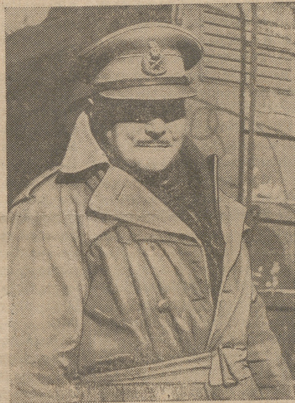
El teniente general Freyberg, jefe de la División neozelandesa del VIII Ejército británico, que actúa en el frente de Cassino.