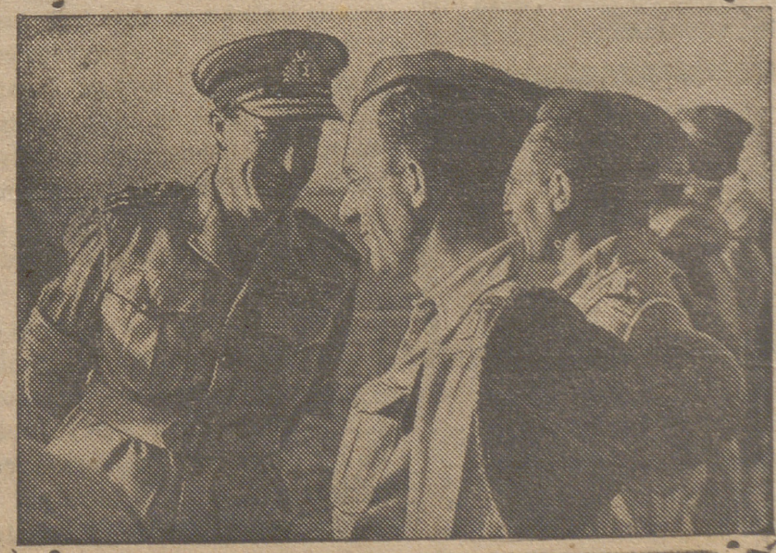
El almirante Lord Louis Mountbatten, jefe de las tropas aliadas en el sudeste de Asia pasando revista a tropas inglesas en el frente de Arakán.

Las bajas se consideran muy cuantiosas para ambos bandos. La posición que constituye la base para el asalto al monte del monasterio fué recobrada ayer por las tropas indias. Los aliados tienen firmemente en su poder otras tres posiciones de analoga importancia estratégica al oeste de Cassino.—EFE.