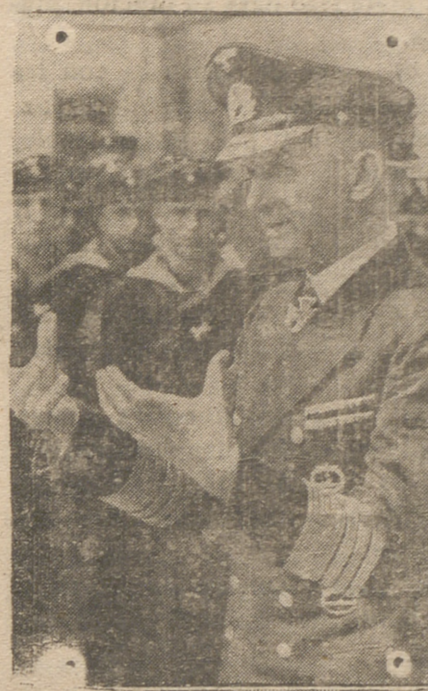
El gran almirante Doenitz, condecorado como el 223 soldado alemán que recibe las Hojas de Roble de la Cruz de Caballero de la Cruz de Hierro...