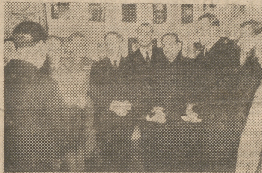
Los ministros secretario general del Movimiento y de Agricultura camaradas José Luis Arrese y Primo de Rivera, asisten a la inauguración de la Exposición de la Semana Santa Malagueña que ha sido abierta en el Círculo de Bellas Artes de Madrid.

MADRID. — El embajador de Francia ha visitado al ministro de Justicia para hacerle entrega de un mensaje del presidente del Consejo Municipal de París. En dicho mensaje se agradece al señor Aunós, en nombre de la ciudad, la Biografía de París, recientemente publicada.