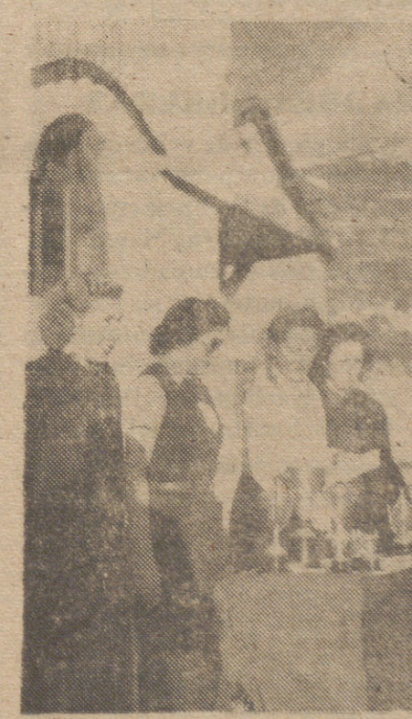
Jararquis de la Falange Femenina en el momento de hacer entrega de los trofeos a las ganadoras de las pruebas de esquí al terminar los Cursos de adiestramiento de la Sección Femenina del Frente de Juventudes.

TOKIO, 6.—Unidades de la aviación de la Marina nipona atacaron, según anunció la radio de esta capital, en la noche del 5 de febrero, y por vez primera, las instalaciones militares abersarias, a seiscientos millas al norte de la bahía de Célán. En cuatro lugares se registraron impactos en los objetivos y fueron provocados incendios. Todos los aviones japoneses regresaron indemnes a sus bases.—EFE.