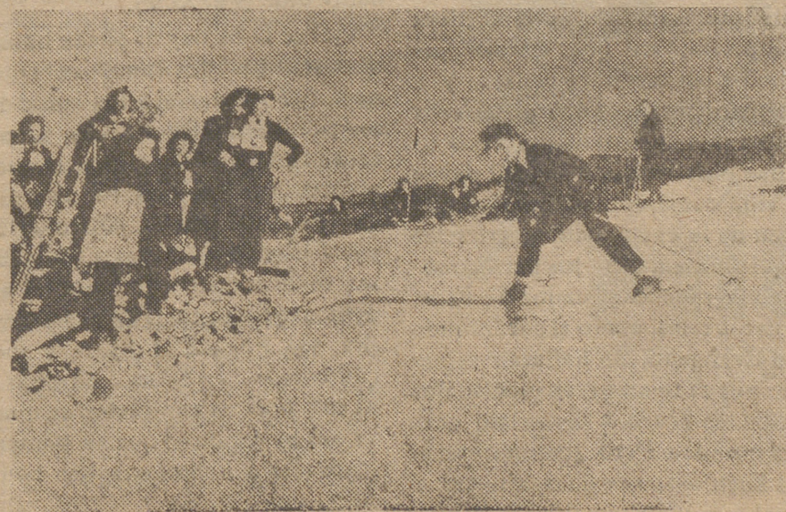
Un momento de la interesante prueba de esquí, celebrada en la Sierra de Guadarrama al terminar el cursillo de adiestramiento de la Sección Femenina del Frente de Juventudes.

«Puede ser—terminó diciendo—que aumente la lista de los mártires entre los policías encargados de mantener el orden y espero que sus camaradas vean en ellos un ejemplo de la pesada labor que tienen que llevar a cabo, de la cual depende la salvación de la Patria».—EFE.