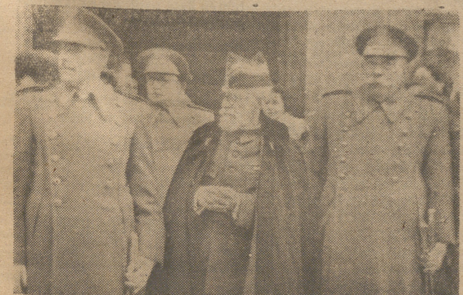
El ministro del Ejército, general Asensio con el general gobernador militar de Madrid en la visita que hicieron al teniente general más antiguo del Ejército, don Enrique Barreto del Rto.

Además, no conviene olvidar que las (Continúa en 4.ª página)