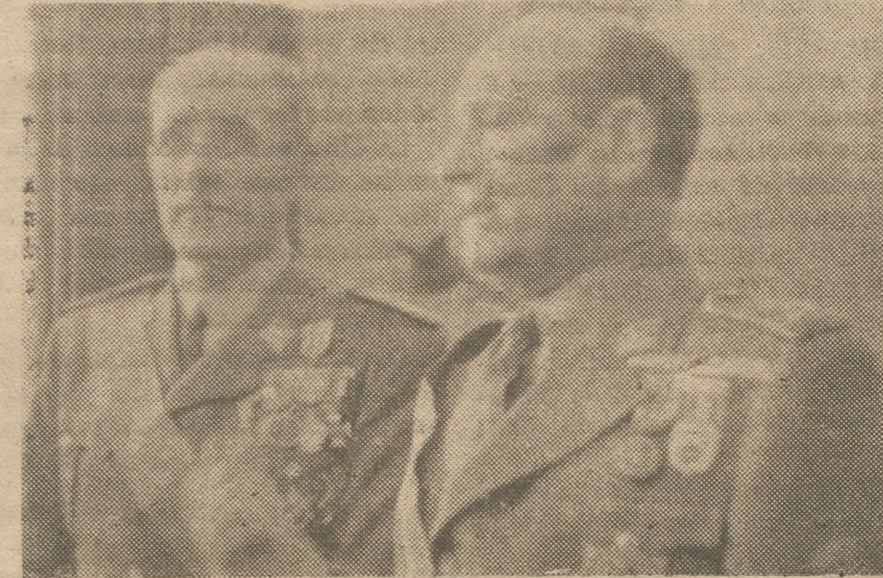
El general Millán Astray pronunciando un discurso durante el acto de la entrega de un busto al ministro del Ejército general Asensio.

los procedimientos de siempre: eliminar y aniquilar a quienes no están con ellos. Y a pesar de los cantos de sirena de su arrepentimiento con respecto a la religión: los botones de muestra que van saliendo a relucir van demostRANDO que el lobo no cambia aunque se vista con una piel de cordero. La «unidad» y la «concordia», aplicadas como lo hacen los comunistas en su «gran campo de acción», lo demuestran plenamente.