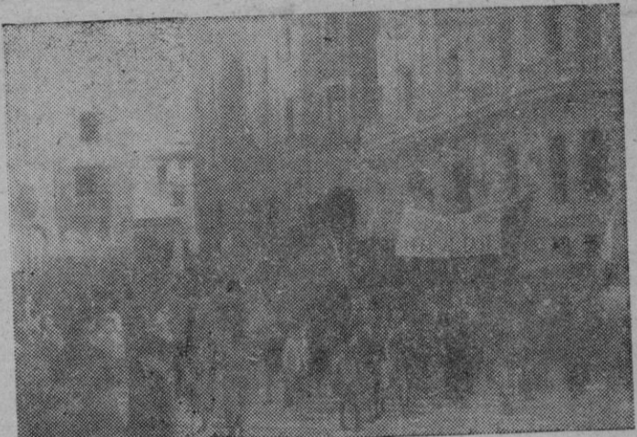
La manifestación estudiantil de ayer al pasar ante el Gobierno Civil

El Ayuntamiento de nuestra ciudad acordó conceder al CAUDILLO la Medalla de Oro, especial y única, de la Ciudad