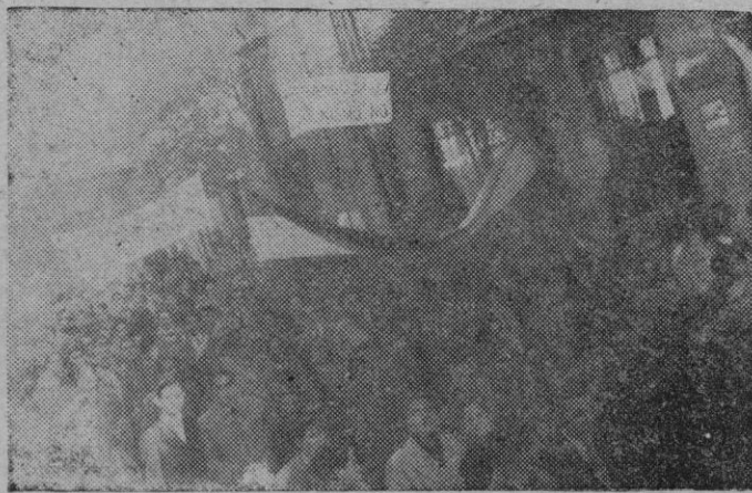
Otro aspecto de la manifestación de adhesión al Caudillo celebrada por los estudiantes