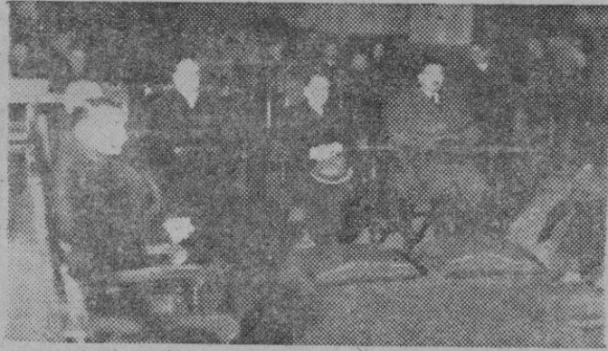
En toda España las asociaciones profesionales de periodistas han celebrado la fiesta de su Patrón San Francisco de Sales. En Madrid el Director General de Prensa presidió la solemnísima fiesta religiosa.