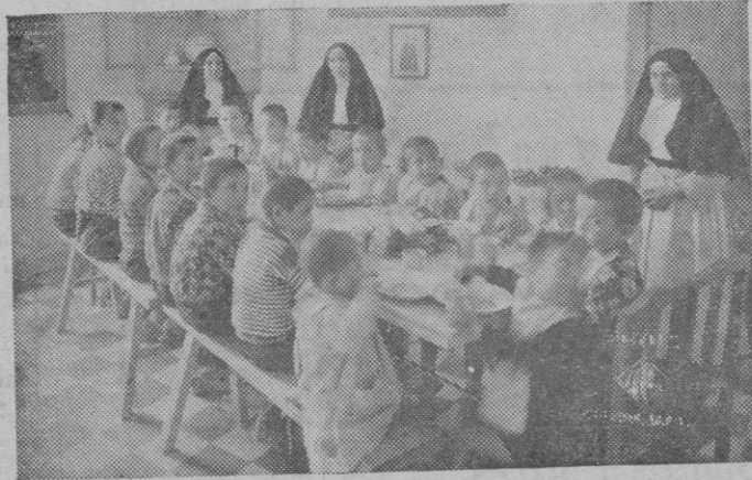
La alegría de los peques a la hora del almuerzo