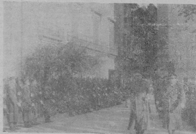
El Excmo. Sr. Capitán General de Baleares revista las tropas de Aviación que le rindieron honores.