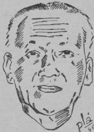
Sergio Osmeña, Presidente de la Mancomunidad de Filipinas.