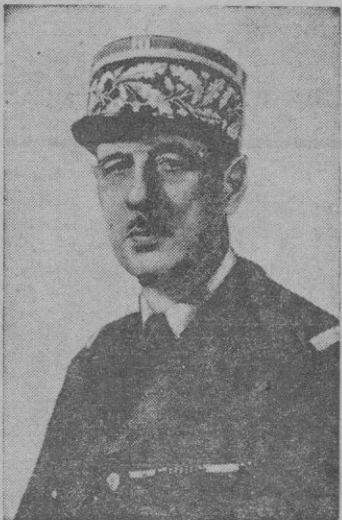
EL GENERAL DE GAULLE

Los recientes acontecimientos de la política interior francesa traen de nuevo al plano de la