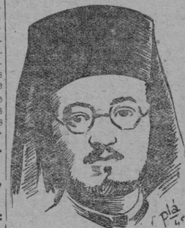
El Regente griego, Patriarca ortodoxo Damaskinos

Londres. — En un discurso pronunciado ante la Conferencia anual de las «Trade Unions» británicas el Presidente del Comité del partido laborista, Laski ha dirigido un apenas velado ataque contra Bevin Ministro de Asuntos Exteriores por lo que el orador calificó de política de continuidad en las relaciones internacionales de la Gran Bretaña. — continuación dijo que no