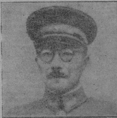
El general Tojo

animó bastante. En los primeros momentos, cuando un médico japonés fué a casa de Tojo acompañado de una enfermera, sin instrumental alguno, de princi-