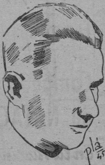
Edward Osuska-Morawski, Jefe del Gobierno y Ministro de Asuntos Exteriores del Gobierno polaco de Lublin.