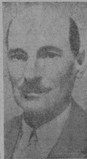
El nuevo "Premier" Mr. Clement Attlee