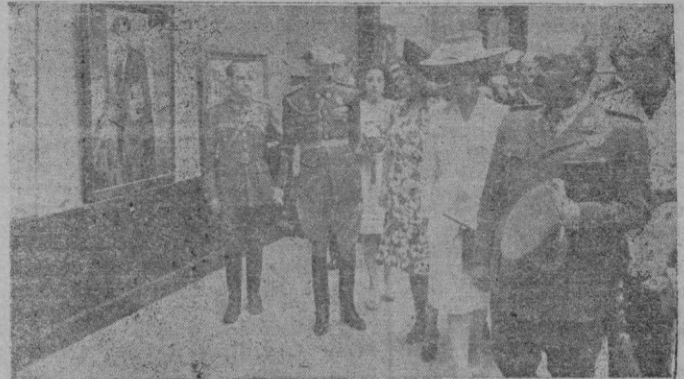
El Caudillo inauguró la exposición Nacional de Bellas Artes en el Palacio de Exposiciones de El Retiro, de Madrid. Acompañado de su esposa, del Ministro de Educación Nacional y otras autoridades y jerarquías nacionales, recorrió las diversas salas del Palacio de Exposiciones.