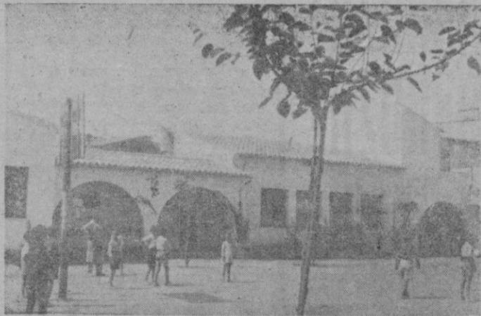
Aspecto parcial del campo de juego, y al fondo parte del edificio destinado a comedor y otras dependencias

La obra del Medio Pensionado de la Sagrada Familia, que con tanta diligencia cuida el Patronato P. de Protección de Menores, es indudablemente una obra excelente y de indudable trascendencia social, merecedora de todos los elogios. Y es una prueba consoladora más de que calladamente, sin buscar otra cosa que ejercer la caridad de modo inteligente, gracias a la cristiana política