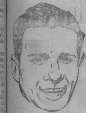
DELIO RODRIGUEZ gran corredor gallego, vencedor absoluto en la V Vuelta Ciclista a España

En dicha reunión serán tomados importantes acuerdos para el más rápido fin de las obras de El Fortín y la buena marcha de la sociedad decana.