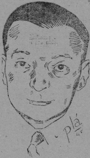
J. Bidault, Ministro de Asuntos Exteriores de Francia, primera figura de la política francesa ligada al triunfo sobre Alemania y cuya intervención en el campo de la política internacional obtiene una destacada personalidad por sus originales aportaciones en defensa de los intereses del imperio francés.

El ejército rojo no intervendrá en la administración civil y se marchará en cuanto hayan sido resueltas las cuestiones que la guerra ha planteado en Alemania. — Efe.