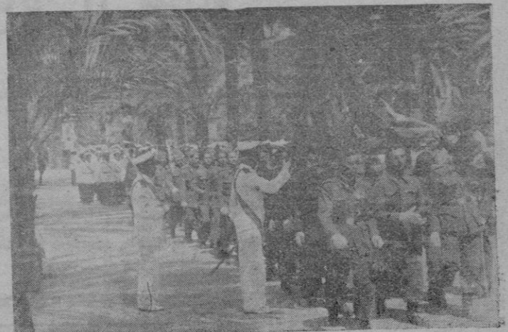
Los reclutas pasando bajo la bandera