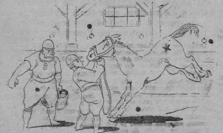
Claro, Bull, como no está acostumbrado a la serreta, se asustó.

Eisenhower conferenció largamente con Churchill