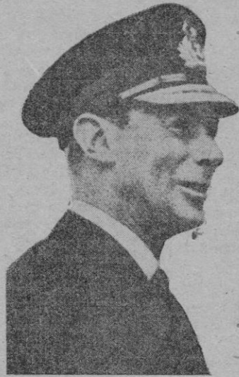
EL REY JORGE VI DE INGLATERRA

Con armas o sin ellas, vosotros, hombres y mujeres de Inglaterra, habéis luchado, habéis