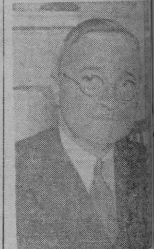
EL PRESIDENTE TRUMAN

Pido a todos los americanos que se mantengan en su puesto hasta que se haya ganado la última batalla. Hasta ese