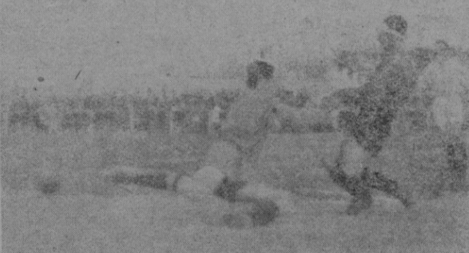
Albella burfa la salida de Galarra... pero el balón saldrá fuera.

do tiempo. Cuando el 2-0 alcanzó el marcador, los donostiarros fueron, durante unos minutos, realmente desbordados. Sólo a última hora, cuando el absurdo "penalty" hizo nacer el temor de que pudiera suceder lo imprevisible, hicieron unos pinitos. Pero sólo por unos minutos. Fué poco elegante en ellos no saber encajar la derrota. Su buen cartel quedaría bastante mejor sin aquel patadillo que uno propinó a Modol, cuando ya Cruella — que hizo un arbitraje modelo de vista, energía y buen criterio — había señalado el fin de la contienda. La técnica de ésta, dejando aparte aciertos o desaciertos de unos y otros, fué el ardor con que disputáronla los veintidós hombres en ella empeñados. Más que en un encuentro de Liga parecía tratarse de un copera, eliminatorio. No en balde los puntos eran de imperiosa necesidad para todos: para los de casa, para no descender para los peninsulares, para ascender.