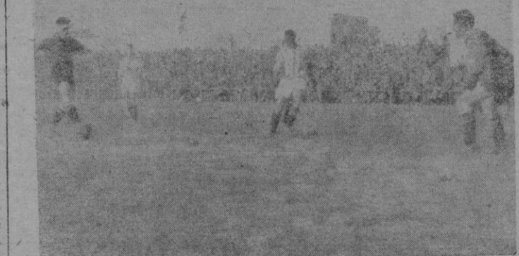
El delantero centro mallorquín se dispone a rematar el segundo gol, culminando una gran jugada llevada con Felipe.

Así, fué posible que, en la rotaguardia, Grech diera la sorpresa de ser un espléndido defensor y de formar, con un Mesquida que derrochó sus acostumbradas valentía y decisión, una bonísima pareja defensiva, tras la que Ramallets tuvo quizá la mejor entre las ya muchas buenas tardes, que lleva dejando el marco decano. Naturalmente, ese jugar de la media influyó decisivamente en el de la delantera donde Albella fué un modelo de eficacia, profundidad e incisión entre los defensas, estupendamente servido por un Felipe que, si no pudo andar constantemente de un lado para otro, en cambio puso al servicio de la línea su conocimiento del juego, sus pasos perfectamente medidos, su serenidad hija de su veteranía. ¡Cómo, en esta delantera, hizo el fino fútbol de Giraldo! Si el rudo batallar de Turro, in-