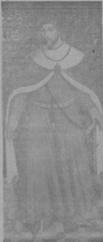
Reproducción del cuadro del Rey Jaime I, que anualmente se expone el 31 de Diciembre en la tribuna de la Casa Consistorial