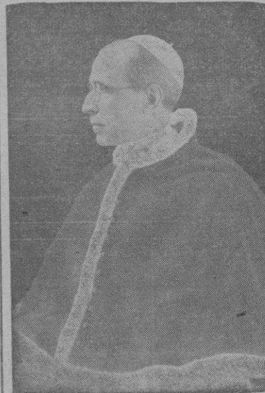
S. S. el Papa Pío XII

A tan gran devoción y tales actividades ¿cómo podría corresponder de otro modo nues-