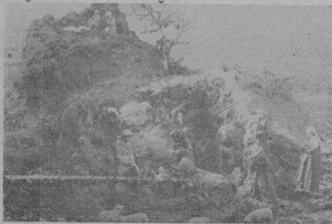
Un Belén de plástica emotiva

y Santa Ana en la que se desarrollan las escenas de genealogía de la Virgen María.