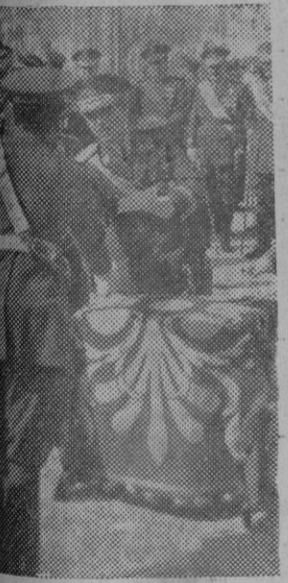
El General Asensio, Ministro del Ejército, entrega los despachos de la Escuela de Transformación