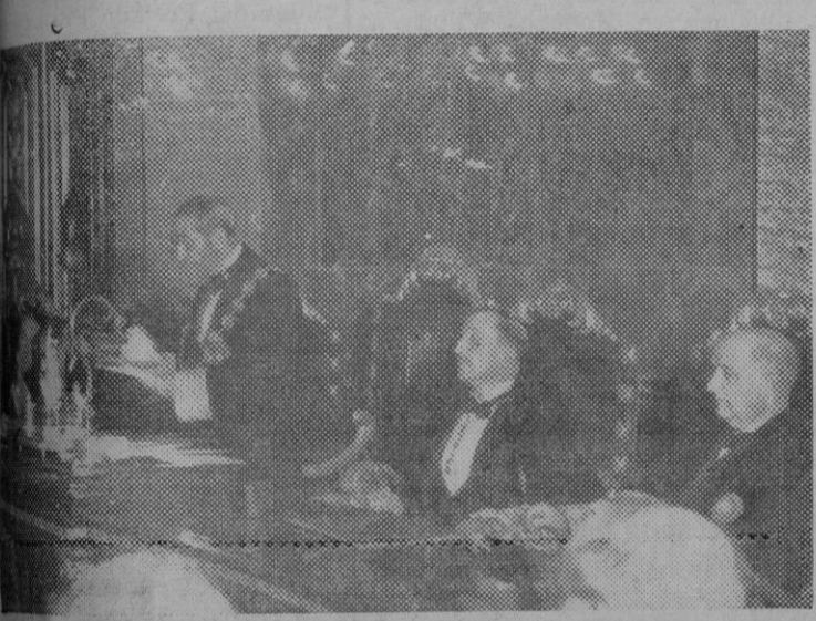
— Momento en el que el Presidente del Tribunal Supremo don Felipe Clemente de Diego, pronuncia su discurso de apertura de los Tribunales.