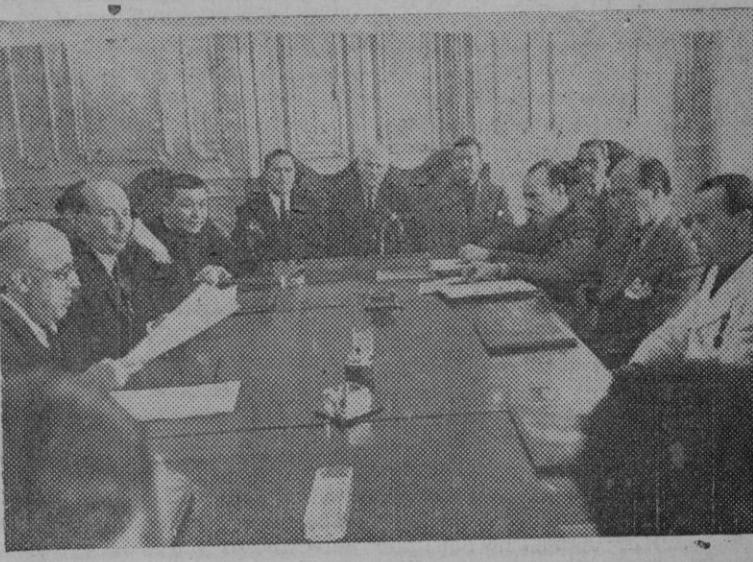
Madrid. — El Instituto Nacional de Previsión ha adquirido la hacienda granadina de Tífontes para cederla a la Hermandad de Labradores de aquella localidad. He aquí el momento de la firma de la escritura, acto celebrado ante el Delegado Nacional de Sindicatos.