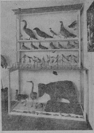
Una de las vitrinas del Museo Graiño

Será esta vitrina ante la que detendrán más su atención los visitantes.