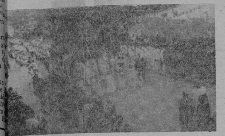
Procesión de la Virgen del Carmen. — La imagen de la Virgen ante el Cuartel de Infantería de Marina. Momento en que se cantaba la Salve

Madrid. — La Marina española solemnizó ayer la festividad de su patrona, la Virgen del Carmen. En la mañana se celebró en el Ministerio de Marina una misa de comunión. Se acercó a la sagrada mesa el Ministro de Marina, acompañado por el Ministro de Marina, Alcaide Moreno, así que acompañaba a la presidencia el Presidente de las Cortes Españolas, don Esteban Llauder, los Ministros del Ejército, del