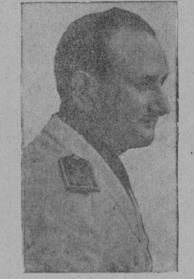
El Excmo. Sr. Ministro Secretario General

Asistir a los actos conmemorativos de mañana es cumplir un grato deber de gratitud y de patriotismo.