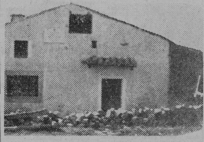
La casa de Ramiro en Alfazaz, una de las más modestas, donde el cariño de la Falange zamorana da que recordará su presencia.

En nuestro pueblo, casi todo lo que un hombre sensato deseara oír sobre Ledesma Ramos se ha dicho y redicho por escritores cuyas opiniones sentiríamos repetir sin sus palabras y cuyas palabras apenas nos sería perdonado repetir. Igual expresión empleó Lockhart en su «Vida de Cervantes» refiriéndose