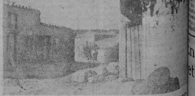
Una calle de Alfazaz, el pueblo cito sayagüés en que vivió Ramiro Ledesma sus primeros años.

Fué un desencanto, un enamorado de España. Se nos fué Ramiro. El hubo de morir en la capital madrileña, en