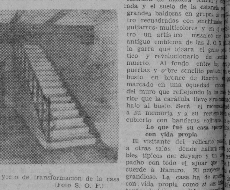
Detalle del vestíbulo, en el proyecto de transformación de la casa Museo de la Falange zamorana.

Se nos fué, Ramiro Ledesma en el ocaso de 1936. Y se tiñó de pena el cielo azul de Sayago. Y lloraron los campos de Alfazaz. La casa miserable cercana a la era cerró las puertas. Un picapedrero rural del barrio de San Lázaro puso una lápida que contaba lo acaecido allí y pintó después de purpuro me- jor. Por las habitaciones desahabadas del antiguo hogar, del hombre, no hay sino silencio y abandono. El amplio zaguán espera. La escalera para el desván se mantiene erguida y cansada. La sala