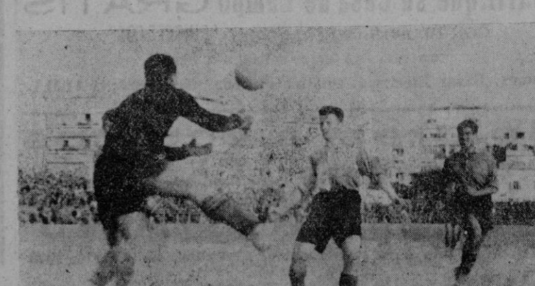
Otra intervención del meta vallesano, que frustra la intervención del centro delantero mallorquín