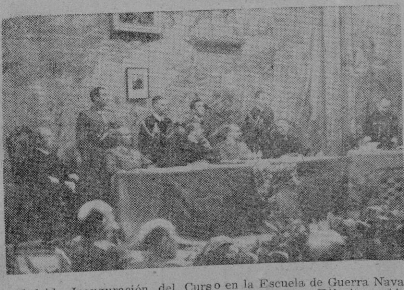
Madrid. — Inauguración del Curso en la Escuela de Guerra Naval, acto que presidieron los ministros de Marina, Ejército y Aire

Sevilla. — Rafael "El Gallo", a consecuencia de una aparatosa cogida que sufrió en Málaga en el festival del domingo, se ha visto obligado a guardar cama en su domicilio. La cogida no reviste gravedad, mas los golpes recibidos son fuertes. En su domicilio ha sido visitado por numerosos toreros y amigos.