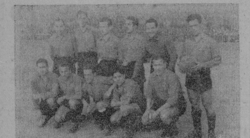
El once decano, que logró venta de dos tantos, seguramente decisiva.