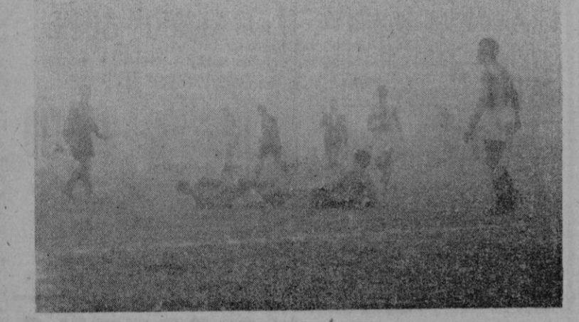
Uno de los "mano a mano" Vidal-Alzamora. En este, el meta blanquiazul bloca la pelota, mientras Azón señala falta.