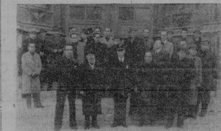
Asistentes a la misa que la Asociación de la Prensa dedicó, el pasado sábado, a su celestial patrono la basílica de San Francisco.