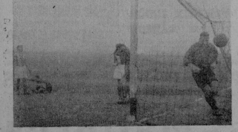
El segundo tanto del "Mallorca". El gesto de los jugadores muestra los bien distintos efectos que en unos y otros produjo la jugada.