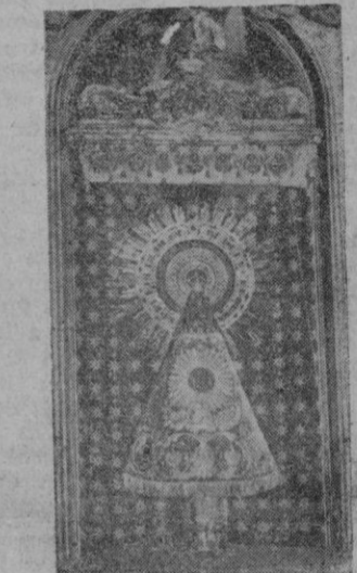
Nuestra Señora del Pilar

Esos textos que de los primeros siglos cristianos no hay, sin embargo, los defensores de la tradición encuentran baruntos no despreciables en la antigüedad cristiana que, juntamente con los testimonios explícitos de los siglos posteriores, pueden servir no poco en apoyo de la misma. En efecto, hay indicios que parecen atestiguar no sólo la existencia del cristianismo en Zaragoza en sus primitivos tiempos, sino también la del templo mismo de Nuestra Señora del Pilar desde la era apostólica. Este es el valor que algunos autores han dado a las comunicaciones subterráneas descubiertas modernamente que de diversos puntos de la ciudad se