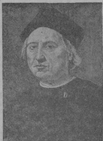
Cristóbal Colón (cuadro existente en Génova)

España descubrió un nuevo mundo desconocido para la humanidad. Pero la gesta de Cristóbal Colón llevada a cabo con las tres gloriosas carabelas que el 12 de octubre de 1492 arribaron a la isla de Guanahani