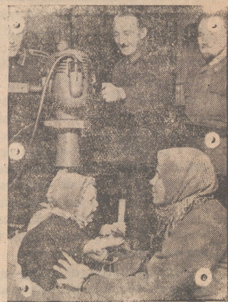
La organización alemana atiende en Rusia a la población civil.

(Del discurso del Caudillo a los productores sindicales el 18 de julio en la plaza de la Armería.)