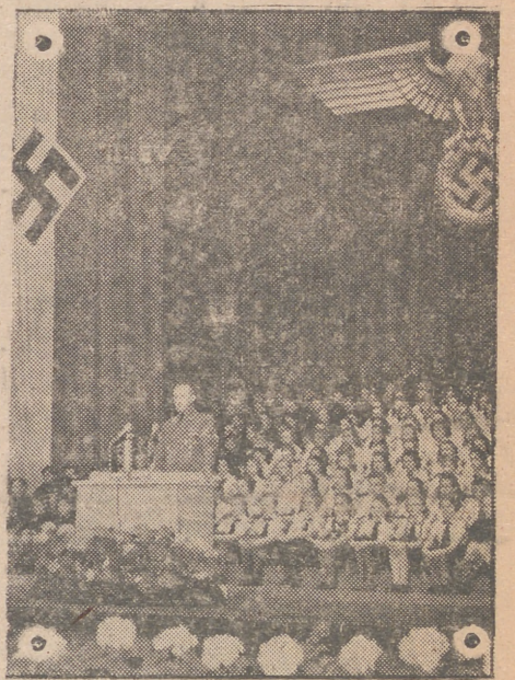
Con diversidad de actos se celebró en toda Alemania el «Día de la Juventud Alemana». Una fotografía del acto celebrado en la Opera Alemana de Berlín.