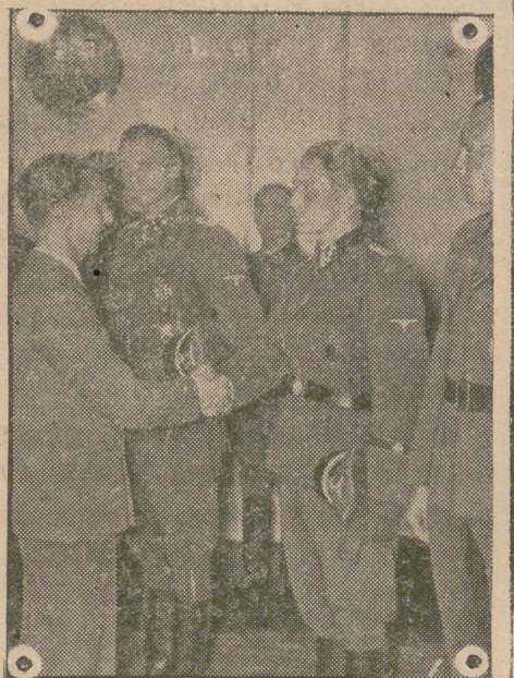
El ministro de Propaganda del Reich, Dr. Goebbels, ha recibido en Berlín a las representaciones de las divisiones de blindados de la SS, «Adolf Hitler», «Alemania» y «Cada una» que fueron los que conquistaron en decidida contraataque alemán la ciudad de Charkow. Goebbels felicitó personalmente a estos valientes.

Los vencedores de Charkof son felicitados por Goebbels