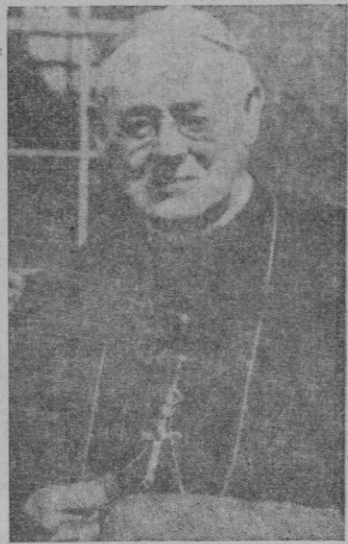
la mañana de ayer, miércoles, el Cardenal Hinsley.

Londres (Urgente). — Ha fallecido a las seis y veinte de