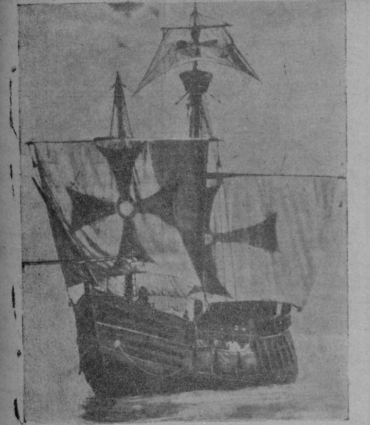
La carabela "Santa María" según la reproducción realizada en los astilleros de Cádiz con ocasión de la Exposición de Sevilla

(Continúa al final de la primera columna de la segunda página)