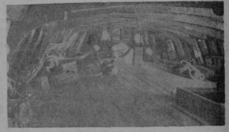
Cubierta principal de la popa de la carabela "Santa María", reconstruida bajo la dirección de don Julio Guillén

La unidad nacional que forjan nuestros Reyes Católicos va estrechamente unida a la unidad espiritual y a la expansión de nuestra fé, y al lado de las banderas de nuestros capitanes marcha inseparable la Cruz del Evangelio. (Del discurso del CAUDILLO en El Escorial)