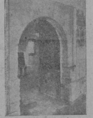
Celda del monasterio, de La Rábida, en la que reposó, según tradición, el ilustre Almirante