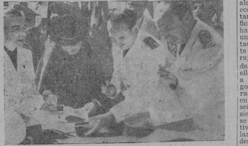
El Ministro Secretario, el Obispo de Málaga y otras autoridades firmando el acta inaugural del grupo de 130 viviendas protegidas, edificadas en el barrio

Almería. — Con asistencia del Ministro Secretario del Partido y su séquito, que ocupaban una tribuna de honor, se procedió a demoler las chozas infrahumanas que habitaban las familias de los pescadores. Después se celebró la bendición de la barriada de nuevas casas para dichos pescadores, en cuyo acto ofició el Provicario de la Diócesis, quien pronunció un discurso laudatorio de la obra realizada por la Falange de Almería en favor de los trabajadores del mar. A continuación el Ministro, Secretario del Partido entregó a cada uno de los beneficiados las llaves de su respectiva vivienda. Cada uno de los favorecidos pronunciaba palabras de gratitud, demostrando cuanto les conmovía y daban gritos de Vivas a Franco y la Falange. Terminó el acto con el canto del "Cara al Sol", dando los gritos de ritual el Sr. Arrese.