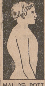
MAL DE POTT