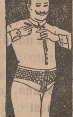
FAJA DE CABALLERO

Piernas artificiales por tendones condensadores, Corsés ortopédicos para desviaciones, mal de Pott.—Aparatos para piernas y pies torcidos.—Tumores blancos.—Parálisis.—Fajas para vientres abultados, estómago y riñón caídos, etc.