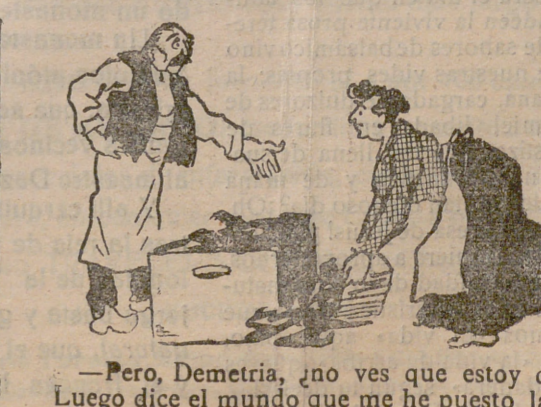
—Pero, Demetría, ¿no ves que estoy descalzo? Luego dice el mundo que me he puesto las botas. —Mira, Rosendo, no hagas caso del mundo porque no guarda más que falsedad en su fondo. No tienes más que fijar tu pupila en el que te se muestra a la vista. ¡No hay na bueno en el mundo!