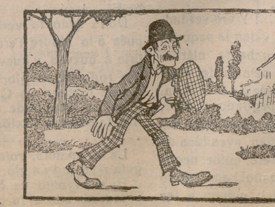
—Que pare, que pare!.. Sí, sí, mientras no paren los acreedores no puedo contarme en el honroso número de los parados. Mientras tanto estaremos las pantorrillas.