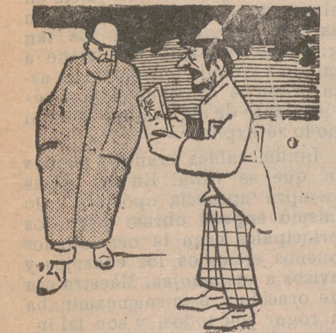
—Por dos beatas, señor, puede ser suyo este magnífico cuadro. —Hombre, precisamente soy laico y ni siquiera cruzo el saludo con las beatas.