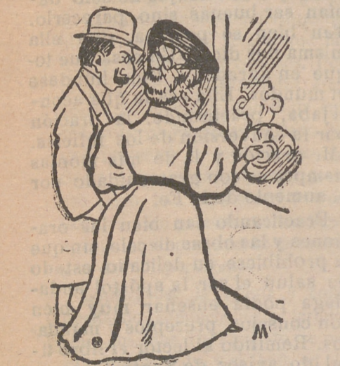
Ella.—Me gustaría tener un sombrero como ese. El.—Ese es un sombrerito de enchufe, prenda, y tu cabeza no se presta a esas modernidades.