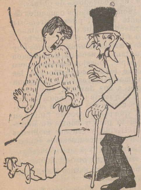
—Querida mía ¿no me conoces? Soy tu marido con el que contrajiste matrimonio hace quince días.

(Prosa rimada) «Que llueva, que llueva, Virgen de la Cueva».