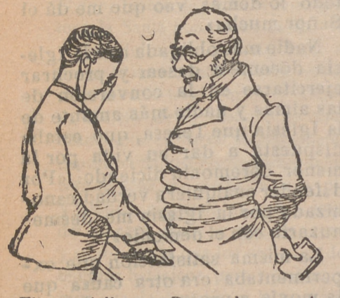
El especialista.—¿De modo que sigue usted sufriendo los mismos insomnios? El funcionario.—Sí, señor, sí, y en tal grado que ya no consigo dormir ni en la oficina.