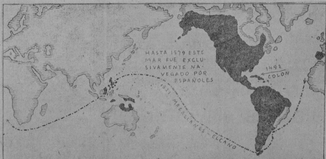
Ciertamente en el siglo XVI estaba presente por medio de su Marina en todos los mares del mundo, prueba de ello son las regiones inmensas que descubrió y colonizó señaladas en el mapa con el color negro

A las 12'30. Acto en el Salón Mallorca en el cual hablan a las J. O. N. S. de nuestra Organización. Palma, 17 de Abril de 1937. EL JEFE PROVINCIAL DE PROPAGANDA