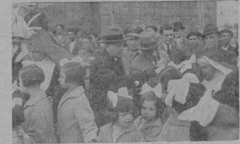
El Gobernador y el Alcalde obsequiando a las niñas de los Asilos provinciales