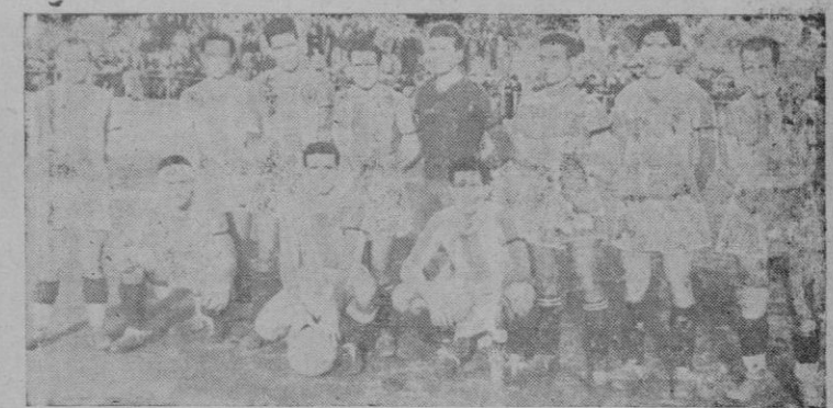
El equipo del "Baleares" que ayer, en "Sa Punta", venció, tras el triunfo del "Atlético"