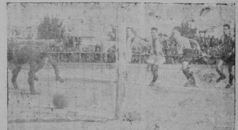
El único tanto de la tarde, logrado, a los 3 ms. del primer tiempo, por Brondo