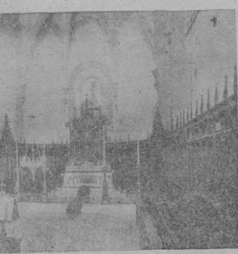
Aspecto que ofrecía el interior de la iglesia con el coro de los Padres, antes de que la sillera de este fuera destruida por la tea incendiaria de los rojos

preceptuado, el cementerio — ¡que los rojos dejaron sin cimientos — se agrupan las celdas, que más que celdas son casitas, de varios compartimientos, cada una con su vestíbulo llamado del Ave María, por la que reza el cartujo al entrar en él; con su dormitorio y lugar de oración y estudio; con su taller para trabajos manuales; con su pequeño jardín; con su reducida galería y su mirador cubierto por un tejadillo, desde el cual se otea bello panorama. Las celdas llamadas inferiores son las de más carácter; tienen un aire primitivo que encanta. Muchas de las otras sufrieron un sensible cambio durante el dominio de los rojos: las antes enaladas paredes fueron estucadas en colores claros, porque la Cartuja fué destinada a estancia de heridos y lejania!