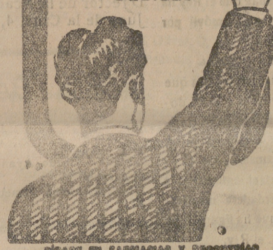
SE VENDE EN FARMACIAS Y QUINCIAS

y los Médicos le llaman el REMEDIO DE LOS DÉBILES