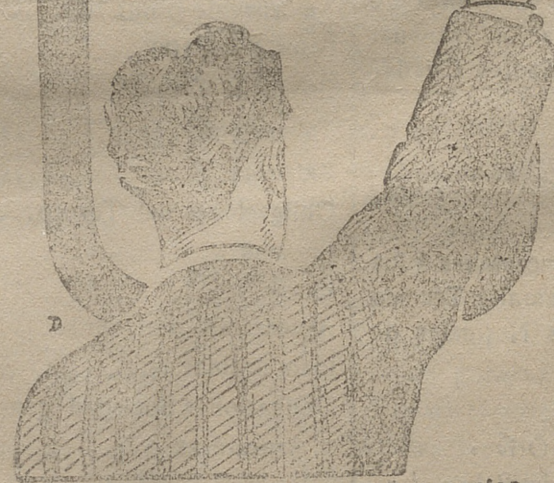
PÍDASE EN FARMACIAS Y DROGUERIAS

y los Médicos le llaman el REMEDIO DE LOS DÉBILES